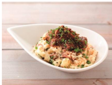
関西「めっちゃうまいやん！ ほっかけポテトサラダ」