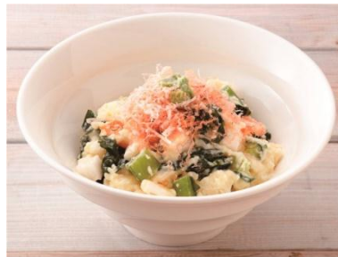
信越「えれうめえな！ わさびと野沢菜のポテトサラダ」