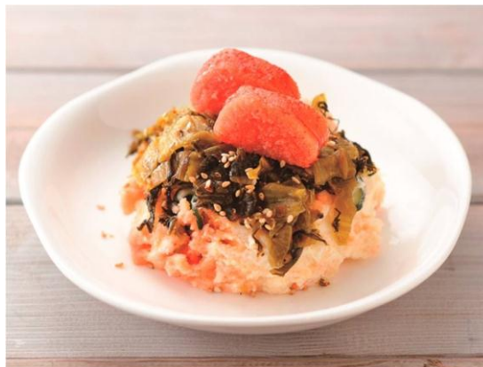
1位：九州 バリうま！辛子明太子と高菜のポテトサラダ

投票の結果、 ご当地ポテトサラダ1位に輝いたのは、九州の「バリうま！辛子明太子と高菜のポテトサラダ」 。辛子明太子のピリッとした辛さと高菜の食感が非常にマッチした一品です。ご飯のおかずにも、お酒のおつまみとしても楽しめる万能ポテトサラダです。