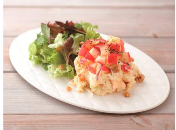
3位：東北「まんずんめなあ〜！ りんごのデザート風ポテトサラダ」