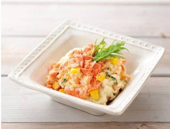
2位：北海道「なまらうまい！ 鮭を味わうポテトサラダ」