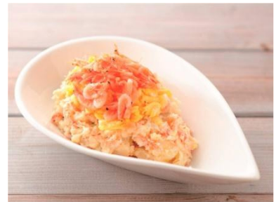
中部「うまいら〜！ 桜えびの 香ばしポテトサラダ」