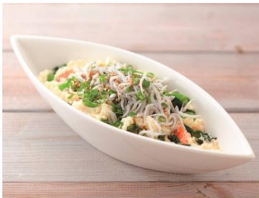
関東「おいしいじゃん！ しらすと小松菜のポテトサラダ」