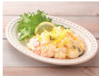
中四国「ぶちうまいけえ！ レモンの 爽やかポテトサラダ」